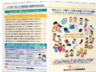
低年齢のお子様をお持ちの保護者向け資料