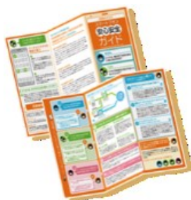
スマートフォン安心安全ガイド

青少年のスマートフォン利用のリスクを、具体例を用いてわかりやすく解説すると共に、保護者としてどのような対策が必要なのかを詳しく解説しています。 また、各種ツールの印刷用データもご用意しておりますので、ダウンロードの上、ぜひご活用ください。